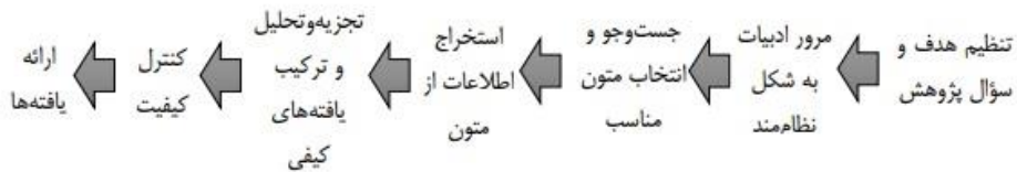
شکل ۱. گام‌های روش فرا ترکیب

برای یک‌پارچه‌کردن پژوهش‌ها به شکلی نظام‌مند، جامع و قابل فهم است. در روش «فرا ترکیب» داده‌های اصلی پژوهش‌های منتخب، ترکیب و تفسیر می‌شود. هرچند روش فرا ترکیب با روش «مرور نظام‌مند پیشینه پژوهش» دارای شباهت‌هایی است، اما تفاوت‌های مبنایی نیز با آن دارد. برای نمونه روش «فرا ترکیب» به مطالعات مقدماتی مبتنی بر گفتگو و تعامل با یکدیگر و تلاش خلاقانه پژوهشگر نیاز دارد. به دلیل جدید بودن و کم بودن منابع مربوط به موضوع حکمرانی پیش‌نگر، برای پیشنهاد الگوی مفهومی از روش «فرا ترکیب» استفاده شد. روش فرا ترکیب دارای نوآوری نسبی در پژوهش است. در یافته‌های پژوهش، توصیف نظری جدیدی همراه با پیشنهاد‌های کاربردی ارائه شده است. در این پژوهش به دلیل اینکه الگوی سندلوسکی و باروسو (۲۰۰۷) در پژوهش‌های فرا ترکیب بیشترین استفاده را داشته است به کار گرفته شده است. مراحل روش فرا ترکیب در شکل شماره ۱ نشان داده شده است: