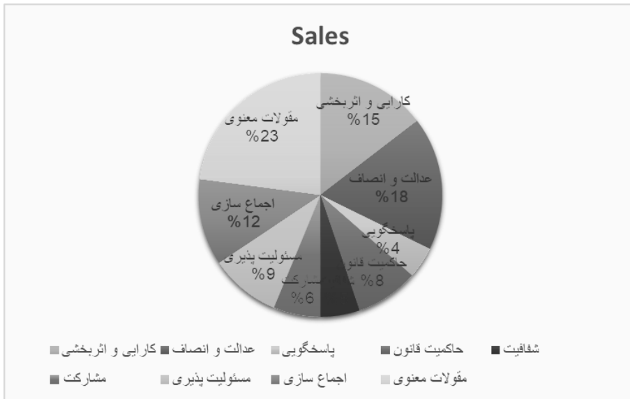
نمودار ۱. توزیع مفاهیم نامه ۵۳ نهج‌البلاغه در مقوله‌های حکمرانی خوب