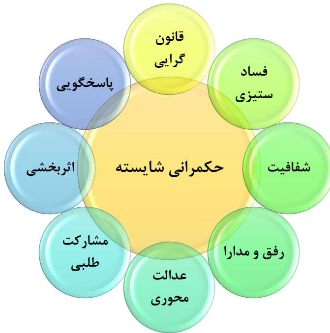
شکل ۱- ویژگی‌های حکمرانی شایسته (درخشه و موسوی نیا، ۱۳۹۷)